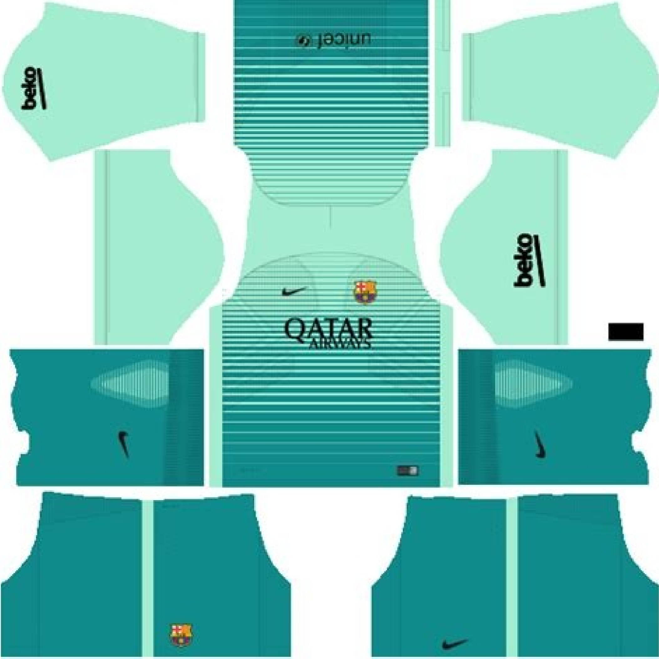
Dls kit barcelona 2017/18. Kit do barcelona dls 2017. Kit dls barcelona 2017 kuchalana.